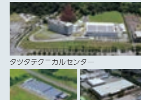
タツタテクニカルセンター

当社は、システム・エレクトロニクス事業の拠点としてタツタテクニカルセンターや仙台工場を設置し、新規事業の開発、事業継続計画に対応しています。また、将来の事業拡大が期待される機器用電線事業においては、エレクトロニクス電線の専門メーカーである立井電線株式会社（現タツタ立井電線株式会社）を子会社化しました。