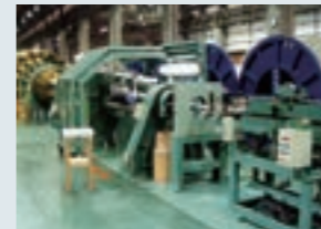
導入した電線製造設備

当社は、1990年頃に当時の最新鋭の電線の製造設備の導入を行いました。最新鋭機の導入により、生産の高速化による納期短縮が可能となり、機械の自動化が進んだことによる電線事業の生産性の向上が進みました。電線の効率化生産体制が構築され、同業他社に比して競争力をつけました。