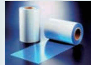
当時の電磁波シールドフィルム

電子機器では、電子技術の発展とともに回路に発生するノイズを防止するため電磁波への対策が課題となっていました。当社は、電磁波に対して優れた特性を持つ導電性銅ペーストを用いた電磁波シールドフィルムを開発しました。電磁波シールドフィルムは、スマートフォンなどの高性能のモバイル機器に欠かせない製品となっています。