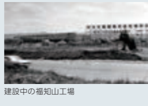
建設中の福知山工場

通信ケーブルの専門工場として、福知山工場（現 京都工場）を建設しました。1990年代以降は、通信ケーブルだけでなく光ファイバケーブルも製造し、通信による経済の効率化と国民福祉の充実や情報化社会の発展に貢献しました。