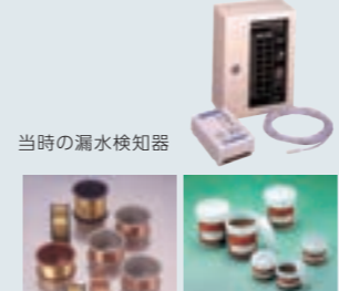
当時の漏水検知器

当社は電線だけではなくエレクトロニクス関連分野にも進出しました。コンピューターや機械設備への水漏れ被害を防止する漏水検知器、回路で使用されるボンディングワイヤや導電性銅ペーストなどの製品を開発し、現在のシステム・エレクトロニクス事業の基礎を固めました。