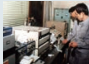
当時の環境分析の様子

高度経済成長期に巻き起こった公害問題に対して、環境計量事業の重要性が高まりました。当社は、大気、水質、土壌の濃度測定を通じて地域社会に貢献すべく環境分析事業を開始しました。その後、同事業を引き継いだ株式会社タツタ環境分析センターは、事業活動を通じて地球環境や労働環境の改善を行っています。