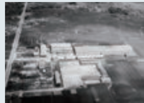
建設中当時の若江工場

電線の生産基盤強化のため若江工場（現 大阪工場）を建設しました。当初は、ビニル電線、綿・ゴム線、燃線、船用線や通信ケーブルを製造。高度経済成長期の旺盛な需要にも対応し、現在も、当社の通信電線事業の製造拠点として、重要な工場となっています。